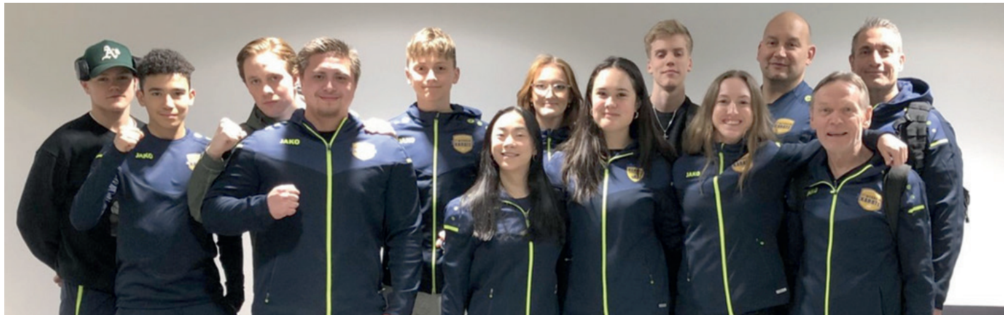
Ovan; Kata och kumitetruppen i Serbien tillsammans med utövare från östra distriktet