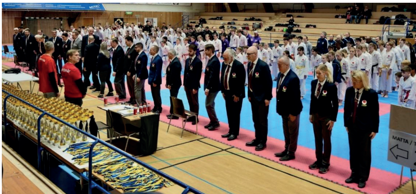
Ovan; SM i Shobu Ippon i Lund

Under 2024 så hölls flera domarutbildningar som genererade flera D samt C domare och dessa fortsatte vi utbilda när dessa började döma ute på tävlingar. Flera av dessa som tog tillfället i akt var glädjande nog kvinnor, i enlighet med kommitténs och förbundets jämställdhetsmål.