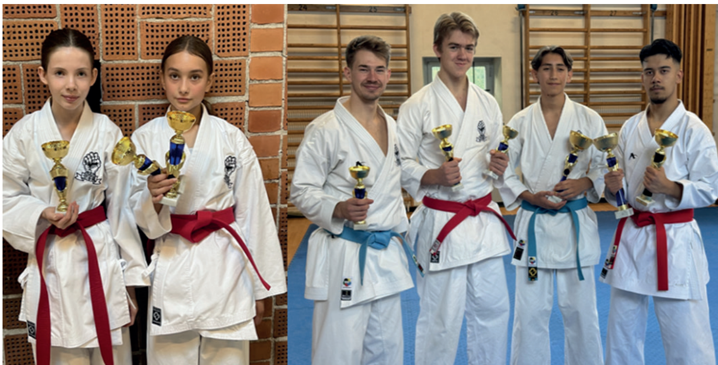
Ovan och nedan; Glada deltagare på DM/DC 2024.